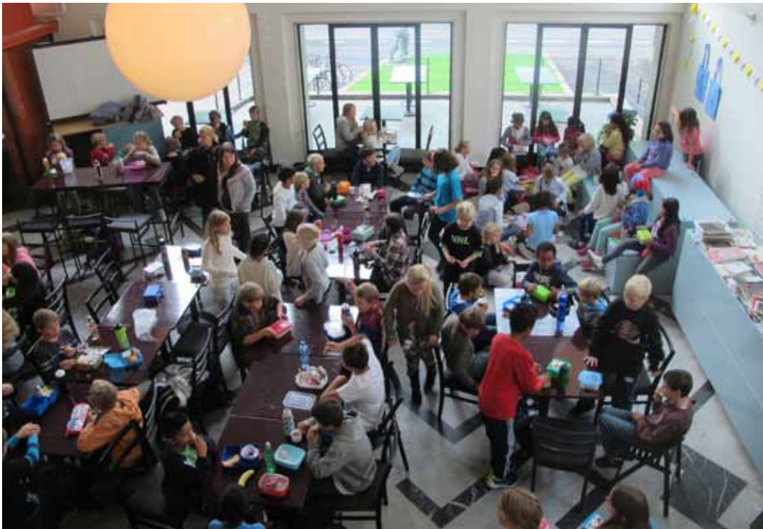
Skoleklasse på omvisning under Høstutstillingen med matpause i kafeen.