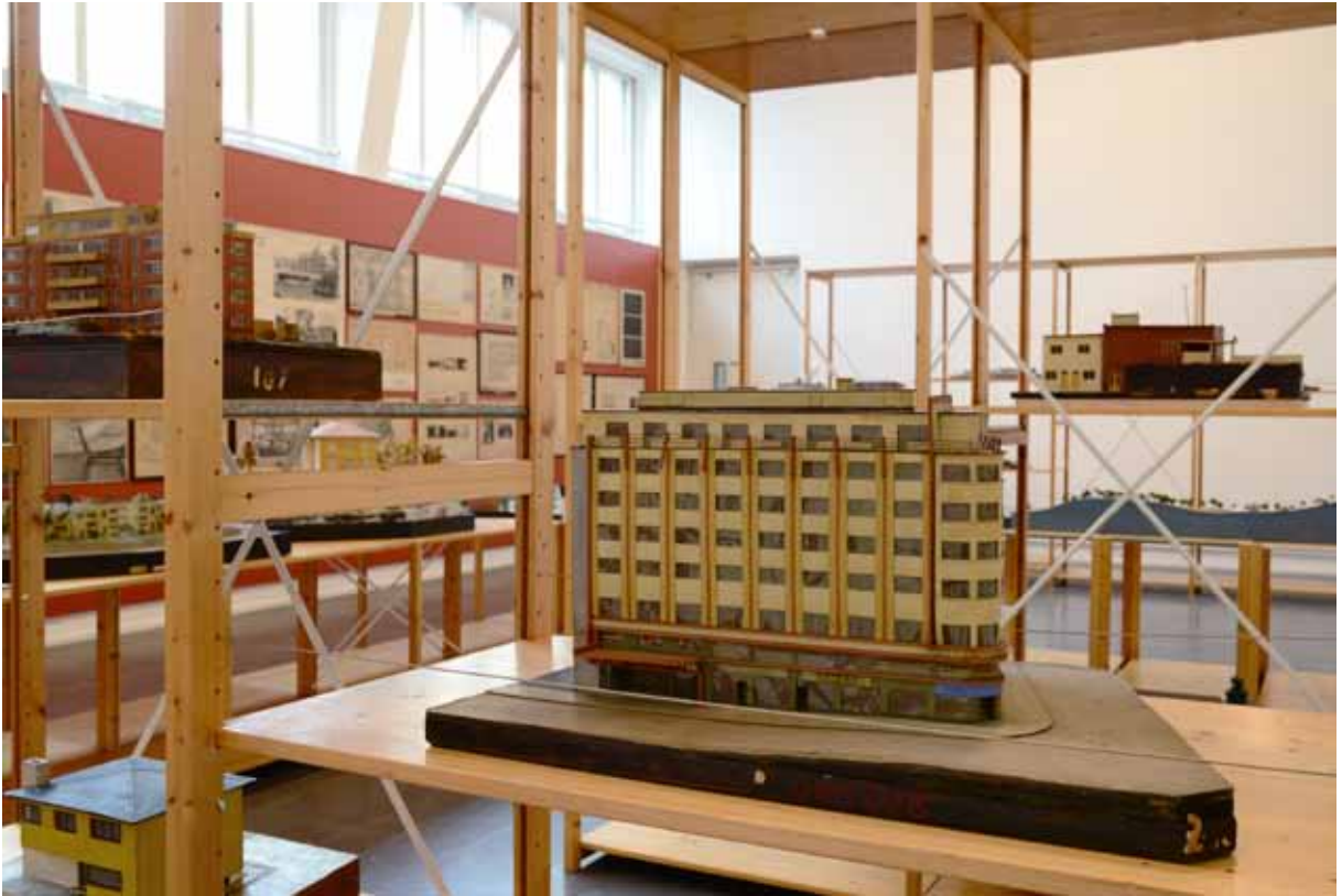
Fra utstillingen Model as Ruin. The Oslo Architecture Exhibition 31/13 , 1. november – 15. desember 2013