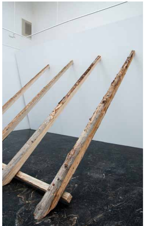
Untitled (Falling Wall) , 2013