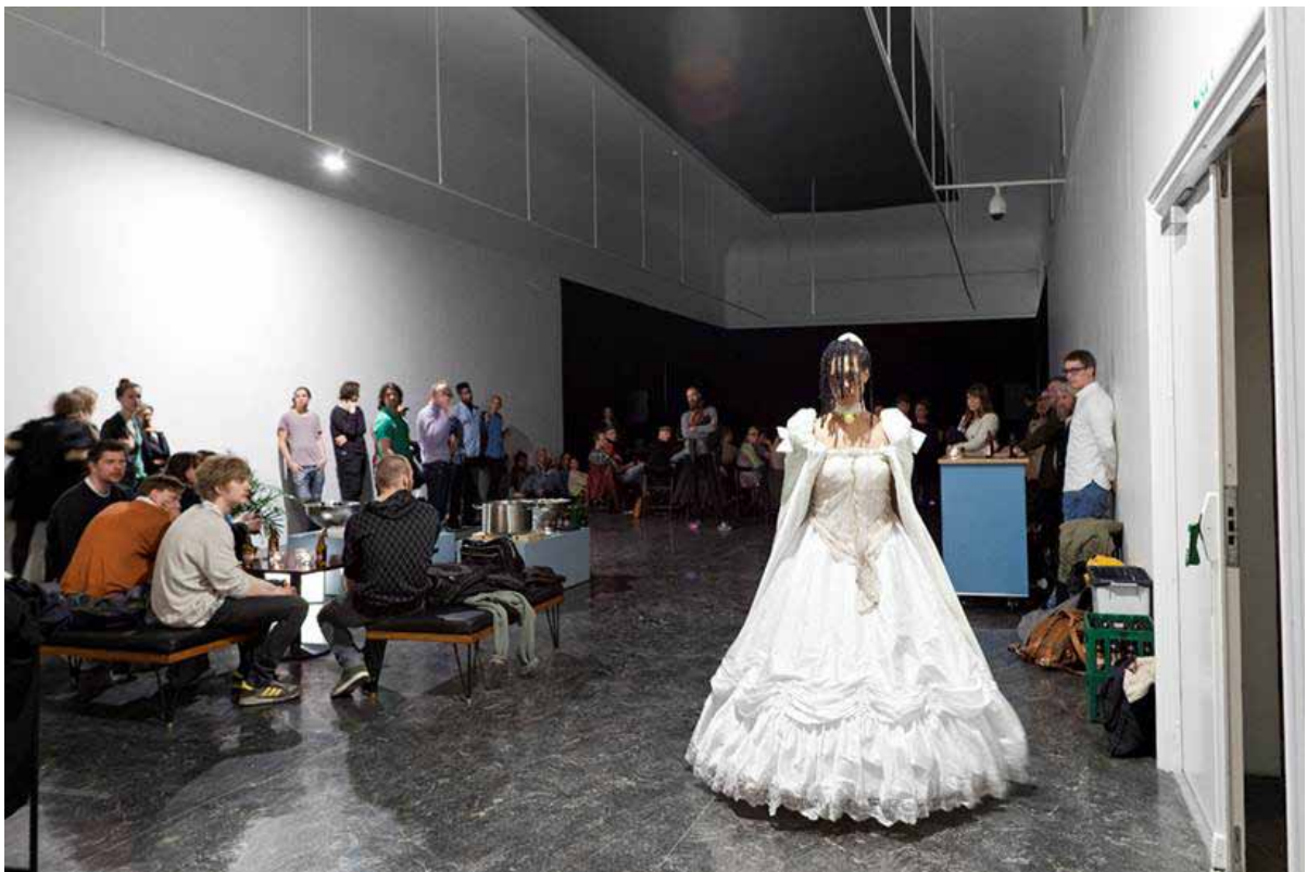
One Night Gallery 6. mai 2013 med performance av Camille Norment, Angels and Demons - The Friction of Water .