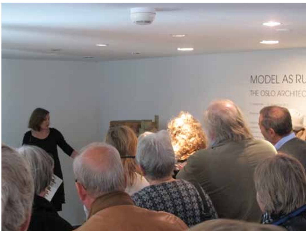
Fra en omvisning i Model as Ruin. The Oslo Architecture Exhibition 31/13

En lørdag i måneden arrangeres miniHuset, et gratis tilbud til barn mellom 6 og 10 år i samarbeid med Oslo musikk- og kulturskole. Her er det spesialomvisning med påfølgende verksted. I vårt populære formidlingstilbud Kunstner viser kunstner forteller inviterte kunstnere om våre utstillinger fra sitt personlige og kunstneriske ståsted. Hensikten er å etablere den kunstfaglige og kollegiale samtalen på tvers av generasjoner og fagfelt.