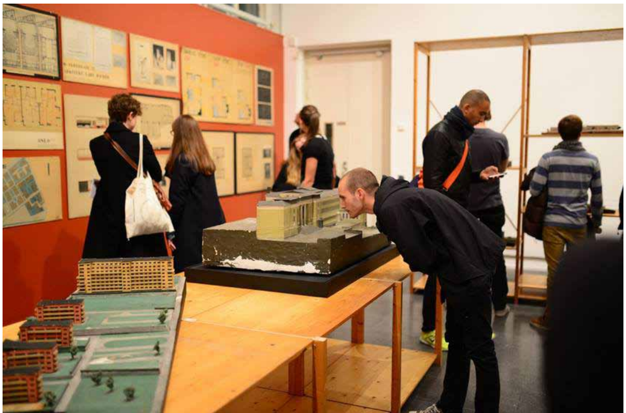
Fra åpningen av Model as Ruin. The Oslo Architecture Exhibition 31/13