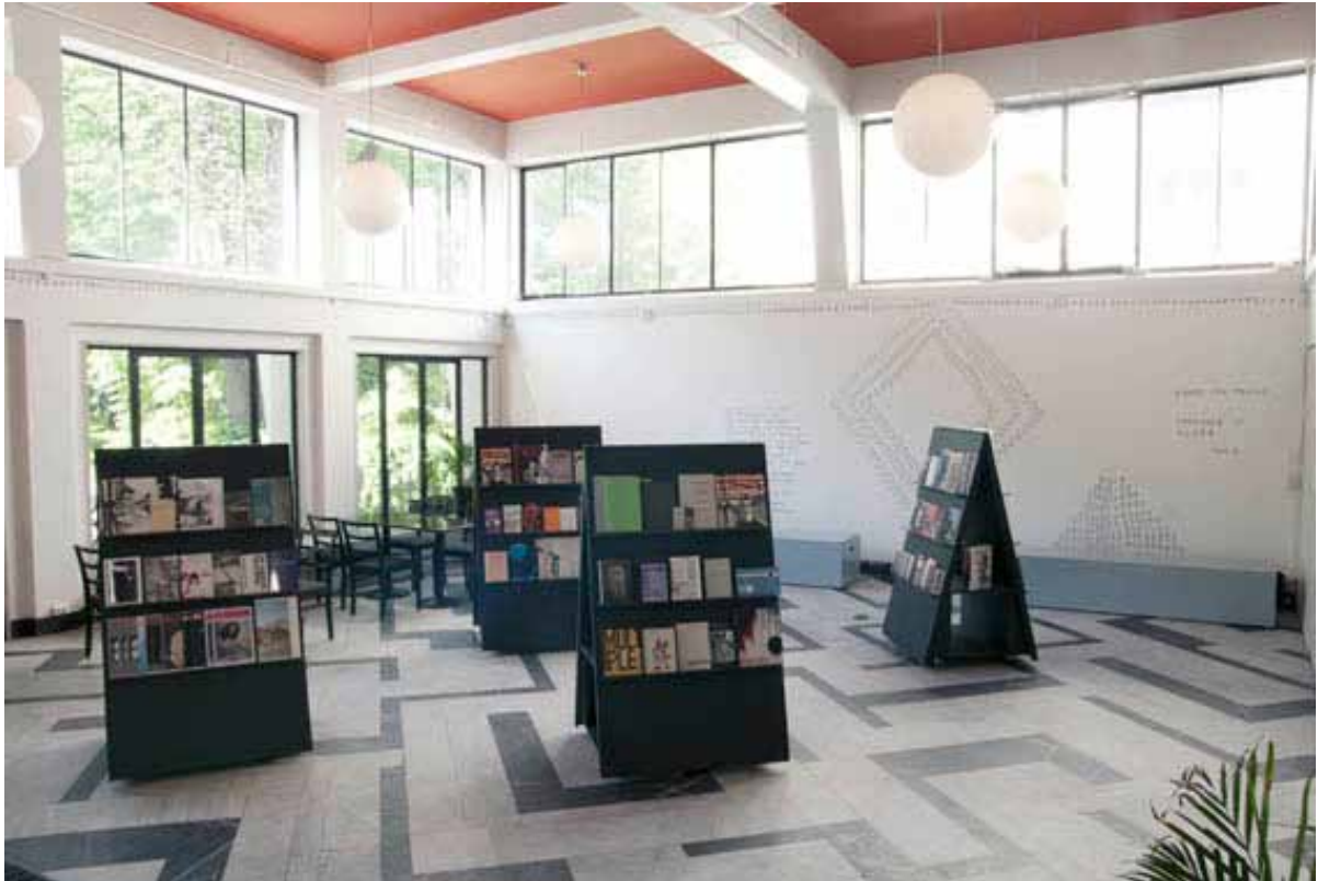
Torpedo bokhandel avd. Kunstneres Hus. I bakgrunnen tekstinstallasjon av Karl Holmqvist, Words are People .