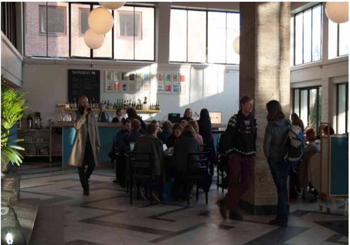
Kunstnernes Hus Bar & Kafé våren 2013

I lokalene for øvrig har det vært arrangert en rekke kunstnersamtaler, forelesninger, seminarer og debatter, både i regi av Kunstnernes Hus og andre kunstfaglige aktører. Blant disse er: Kunsthøgskolen i Oslo (avd. kunstfag), Ny Musikk, Kunstforum, Kunstkritikk, Oslo Poesifestival, Notam, NBK (Norske Billedkunstnere), (Unge Kunstneres Samfund), Norske Kunstforeninger, Oslo Musikk- og Kulturskole, Nasjonalmuseet for Kunst og Norsk Kunstårbok, samt teaterforestillinger og andre kunstnerinitierte prosjekter.